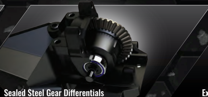
Sealed Steel Gear Differentials