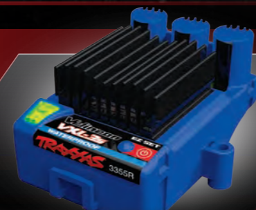
Velineon® VXL-3s Electronic Speed Control