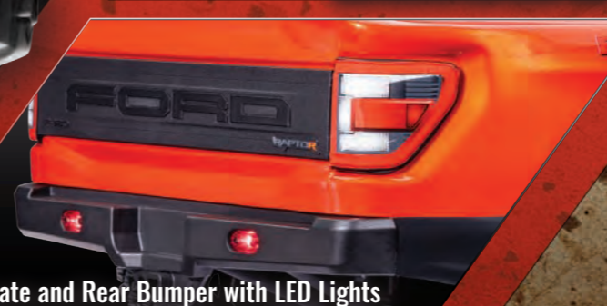
Tailgate and Rear Bumper with LED Lights