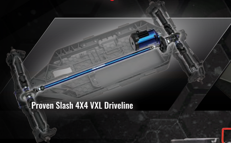
Proven Slash 4x4 VXL Driveline

Traxxas Pro Scale design merges scale realism with Extreme Velineon Brushless horsepower, durability, and 60+mph speed