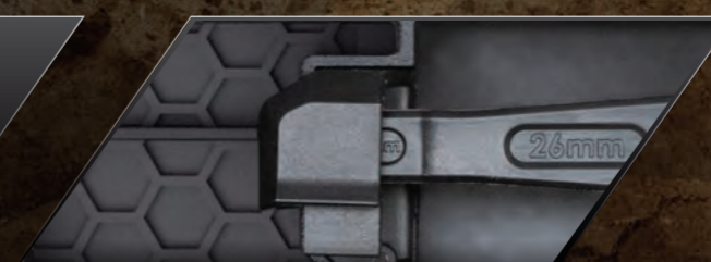
Adjustable Clipless Battery Hold Down