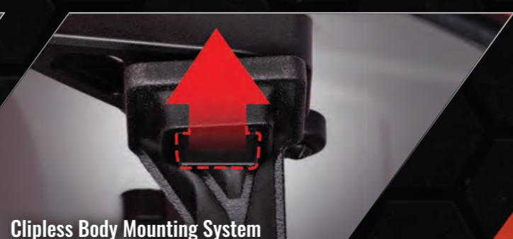
Clipless Body Mounting System