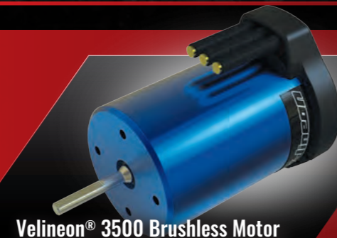
Velineon® 3500 Brushless Motor