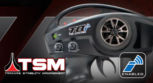
TQi™ 2.4GHz Radio System with TSM®