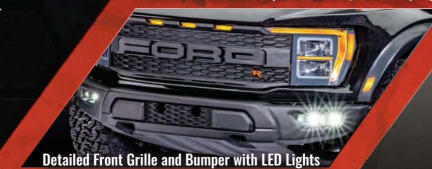
Detailed Front Grille and Bumper with LED Lights