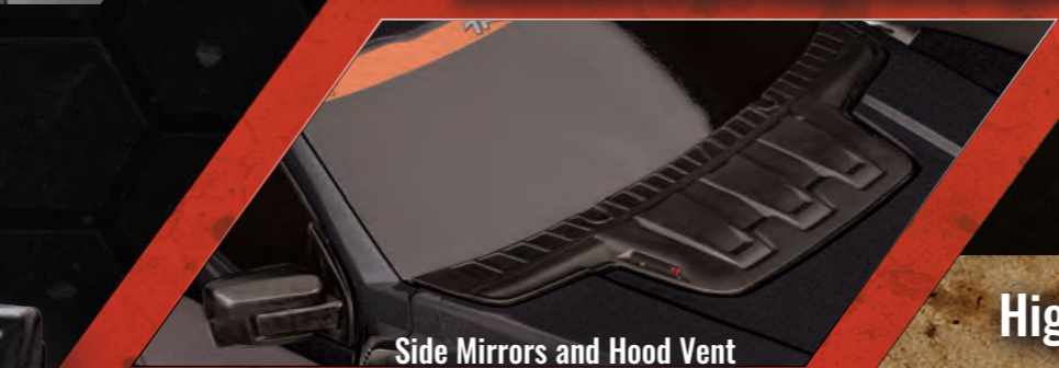
Side Mirrors and Hood Vent

Slash 4x4 VXL Chassis 12.8" Wheelbase (324mm)