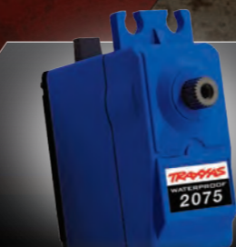
Waterproof Digital High-Torque Steering Servo